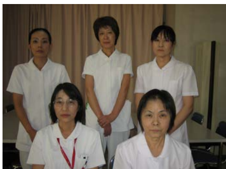
看護部 (部長・師長・主任)