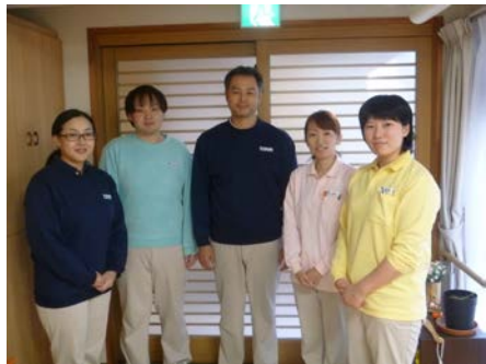
グループホーム あいあい