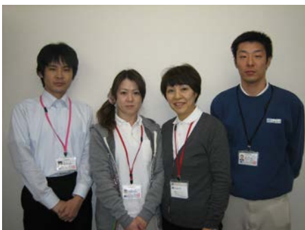
居宅介護支援センター