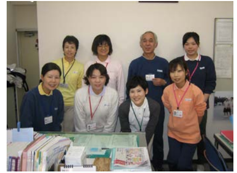
訪問看護ステーション