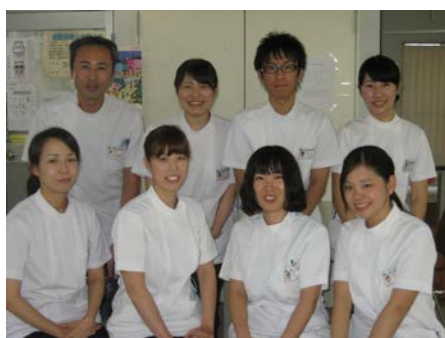
リハビリテーション